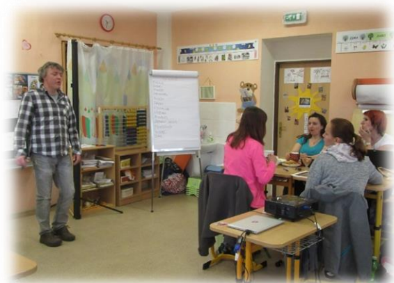
Foto ze semináře Son-rise program